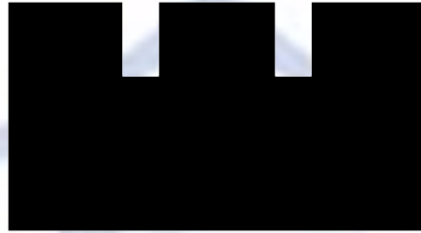
Korrekt siktebilde, det riktige forholdet mellom skur og korn.

Grunnlaget for det presise skudd ligger i riktig siktebilde. Kornet skal ligge midt i skuret med like mye luft på hver side av kornet. Korntoppen skal ligge i flukt med skurets overflate. Holder ikke skytteren det riktige forholdet mellom skur og korn, blir det få gode skudd. Selv om hånden ikke er helt rolig, vil treffene bli forbausende gode bare skytteren holder siktebildet. Det kan virke lett å holde kornet midt i skuret, men problemet er å holde den riktig opp linjeringen og samtidig trekke av. Kunsten er å kunne fokusere øyet på kornet under avfiring, ikke på skiven.